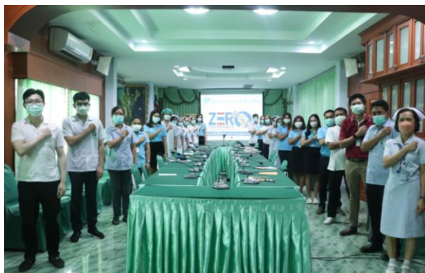
ภาพบุคลากรโรงพยาบาลท่าโรงช้าง

การประกาศเจตจำนงสุจริตของผู้บริหาร โดยผู้อำนวยการโรงพยาบาลท่าโรงช้าง