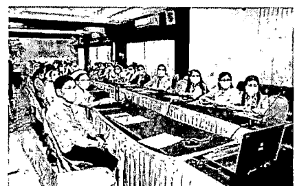
ภาพบุคลากรประกาศเจตจำนงต่อต้านการทุจริตที่โรงพยาบาลท่าโรงช้าง เวลา ๑๓.๓๐ - ๑๕.๐๐ น. ณ ห้องประชุมโรงพยาบาลท่าโรงช้าง