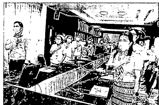
ภาพบุคลากรโรงพยาบาลท่าโรงช้าง