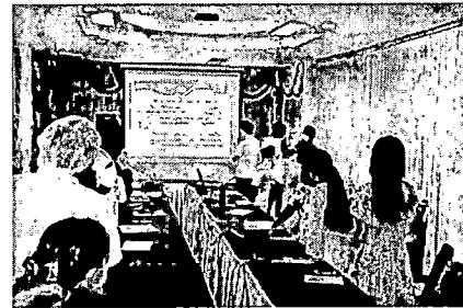
ภาพบุคลากรประกาศเจตจำนงต่อต้านการทุจริตที่โรงพยาบาลท่าโรงช้าง เวลา ๑๓.๐๐ - ๑๖.๓๐ น. ณ ห้องประชุมโรงพยาบาลท่าโรงช้าง