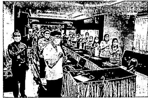
ภาพบุคลากรโรงพยาบาลท่าโรงช้าง